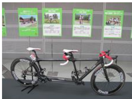
↑パラサイクリング啓発ブース