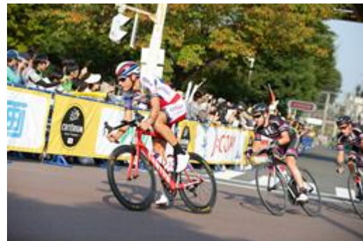
↑ ポイントレースの様子