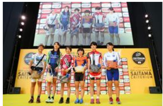
↑女子選手の紹介セレモニー