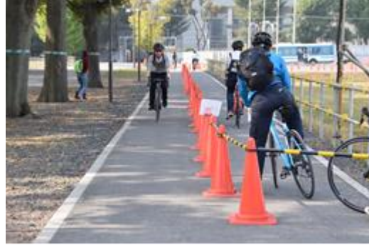
↑ロードバイク走行体験会の様子