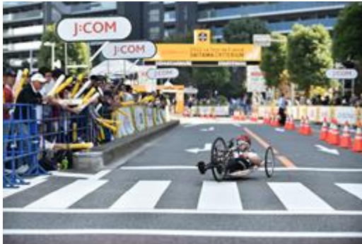
↑タイムトライアルレースの様子①

女子選手は、エリート、ジュニアなどの各カテゴリーの上位選手6名。パラサイクリング選手は、タンデム、ハンドサイクル、競技用自転車の3種から世界選手権優勝者を含む7組8名が参加した。