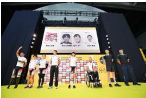
↑パラサイクリング選手の紹介セレモニー