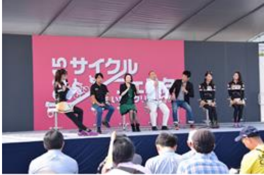
↑サイクルフェスタトークショー

同日開催イベントとして、クリテリウムコース付近にて、自転車競技の魅力を伝えるためのイベントを実施した。ステージでの片山右京氏らによるトークショーのほか、ロードバイクの走行体験会などを行った。